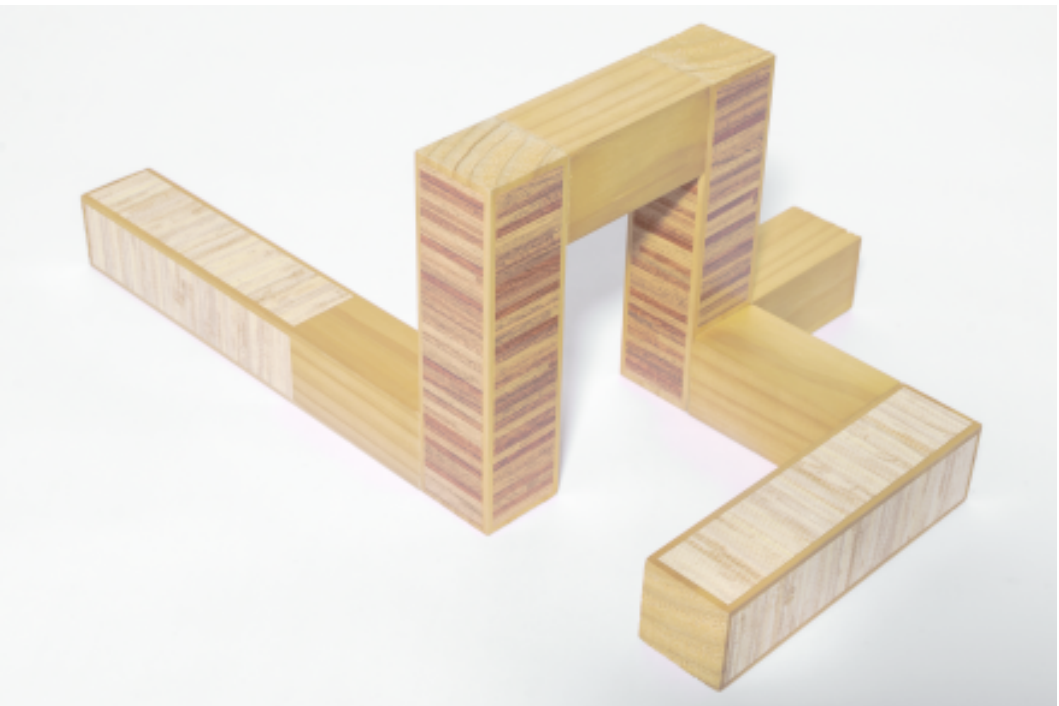
"DAVAMA", 2012-2013. Pino radial, vinilo. 16 x 40 x 24 cm.