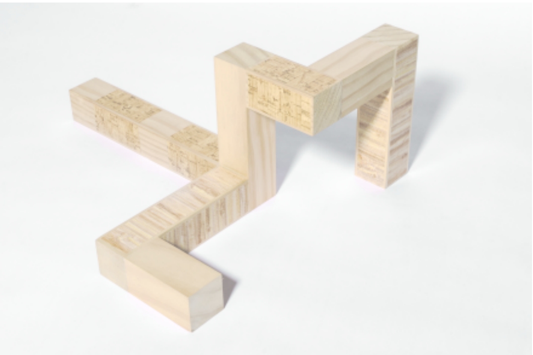
"ZIAN", 2016-2017. Pino radial, vinilo. 16 x 36 x 32 cm.