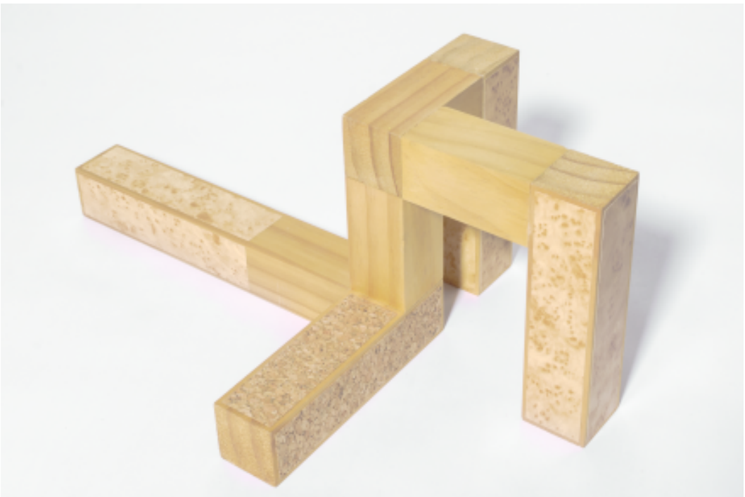
"DAVAMA", 2012-2013. Pino radial, vinilo. 16 x 40 x 24 cm.