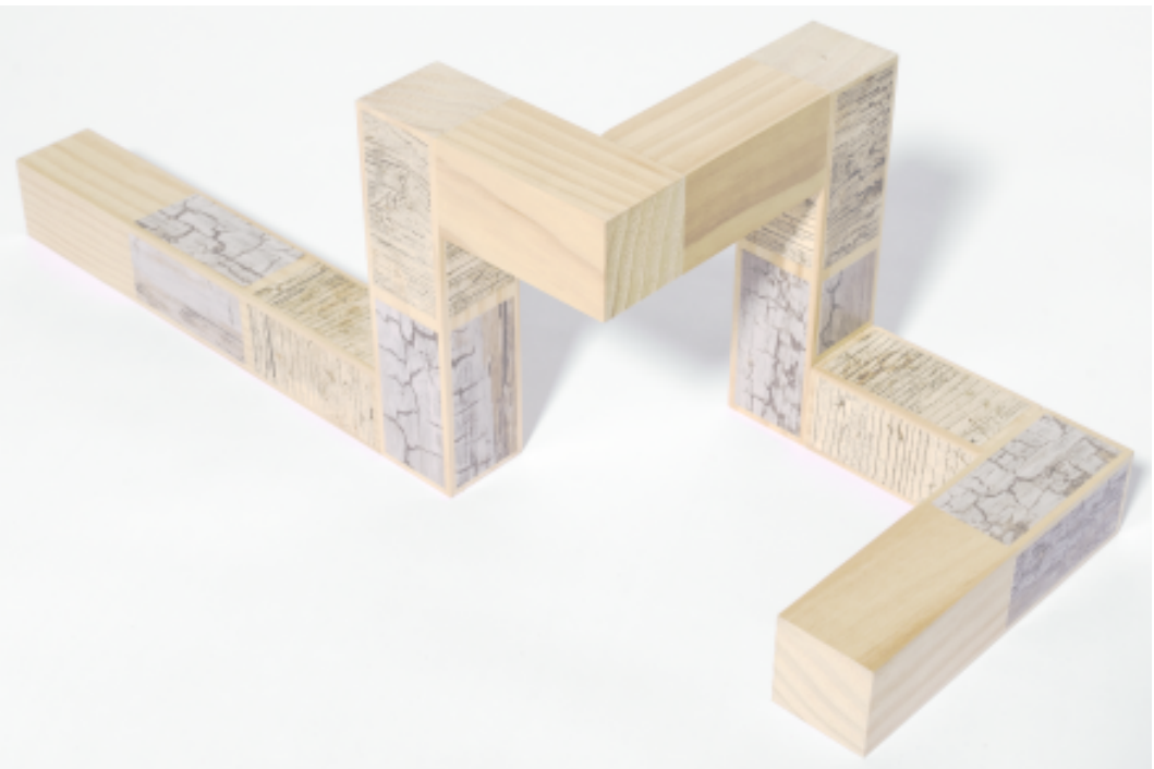
"ZIAN", 2016-2017. Pino radial, vinilo. 16 x 48 x 16 cm.