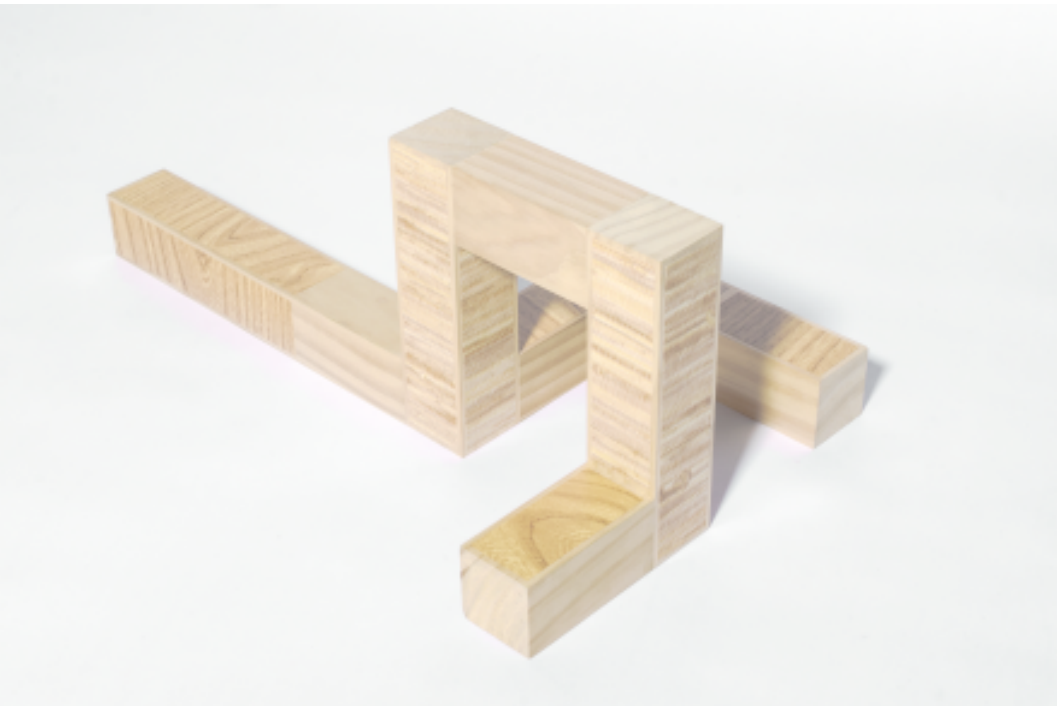
"ZIAN", 2016-2017. Pino radial, vinilo. 16 x 40 x 24 cm.